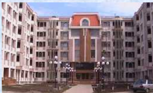
Hotel Gaudeamus – Université « Al.I.Cuza » asplf@gmail.com