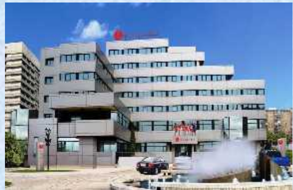
Hotel Ramada Center