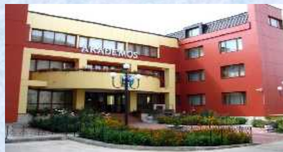
Hotel Akademos – Université « Al.I.Cuza » asplf@gmail.com