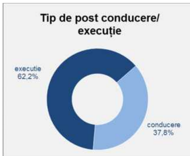
Figura nr. 3. Categoriile de post (execuție/conducere)

O analiză a tipului de post ocupat de participanții la cursurile postuniversitare a fost realizată cu scopul impactului social al acestui curs pe termen lung. Am putut observa că din totalul de 45 de persoane care au absolvit cursul, 17 persoane (37,77%) ocupă posturi de conducere în cadrul instituțiilor angajatoare. Reprezentarea grafică a categoriilor de post este prezentată în de mai jos.